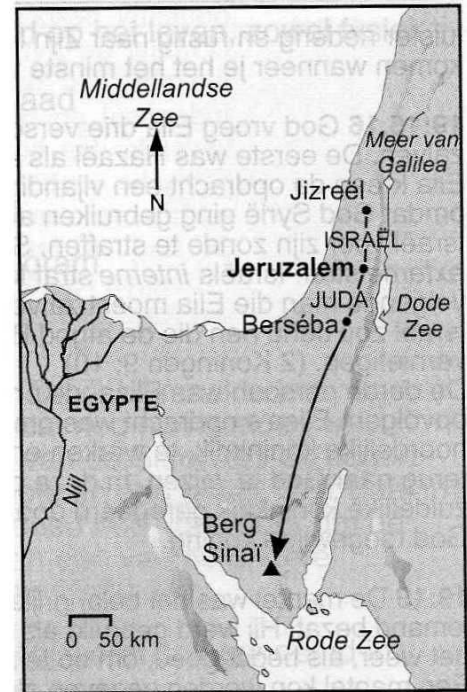
Elia vlucht de woestijn in