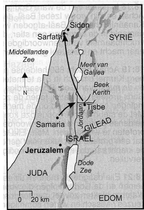
Elia via Kerit naar Sarfath