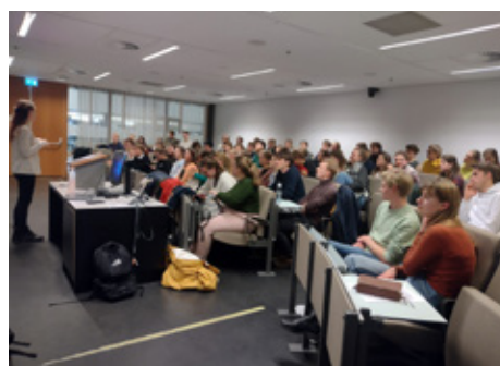
▲ terug- en vooruitblik avond