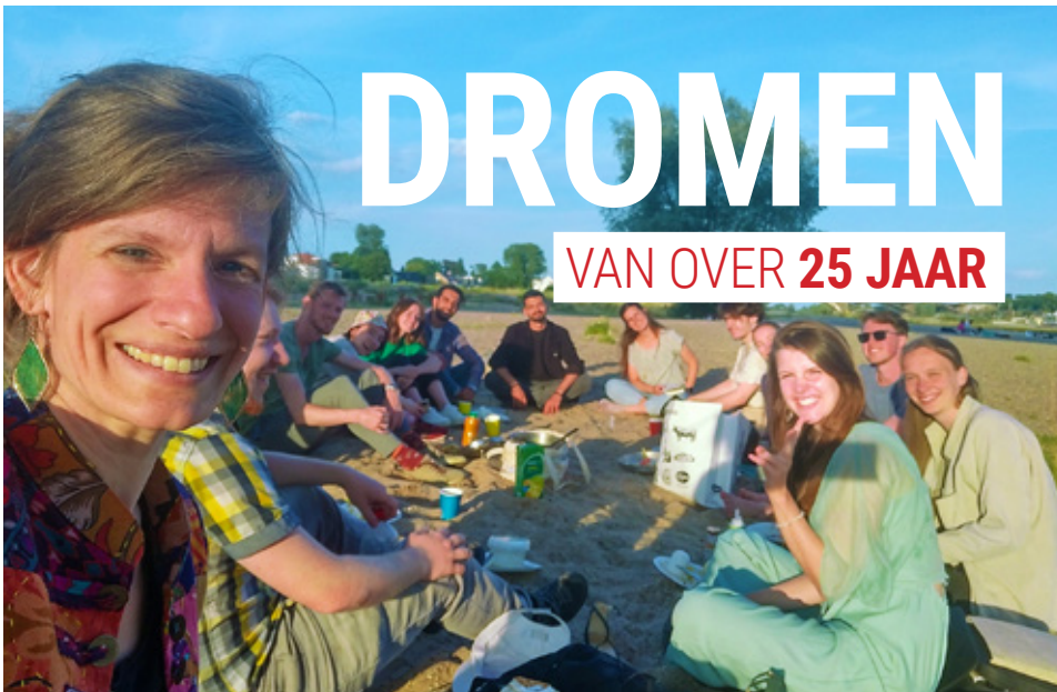
▲ Afsluiting (Hub)seizoen

Eind augustus 2023 hadden we een mooi weekend met Navigators-hub Nijmegen: zo'n 140 jonge studentleiders kwamen samen om toegerust te worden als discipel en als leider. Enorm bemoedigend om daar als Navigators discipelmakers aan bij te mogen dragen: voor hen te bidden, gesprekken te voeren en samen aan tafel te mogen schuiven. Met recht een hoogtepunt van het jaar!