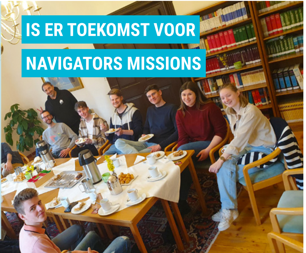
▲ De bijbelschool in Oostenrijk die nieuwe deelnemers gaat ontvangen