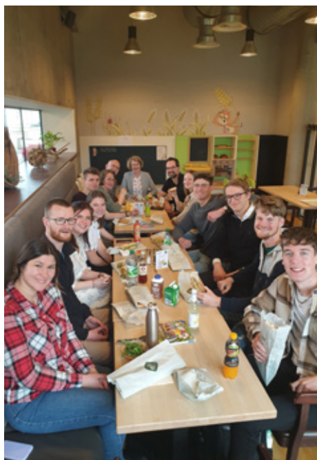
▲ De deelnemers oriëntatiereis Oostenrijk

Sinds een paar jaar biedt Navigators Missions geregeld missiereizen aan en daarmee willen we doorgaan in de toekomst. We hebben de afgelopen jaren reizen geïnitieerd naar verschillende steden in Zweden, Duitsland,