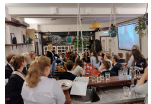
▲ Meeting over missionaire levensstijl